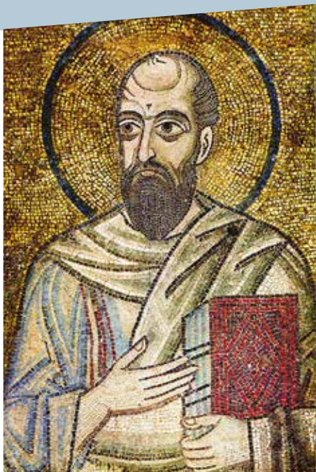
Dieses Werk ist gemeinfrei, weil seine urheberrechtliche Schutzfrist abgelaufen ist. Bild: The Apostle Paul, Datum: 1000, Ort: St. Sophia of Kyiv

ersten Christen. Paulus adressiert seine Briefe auch an uns, die wir heute versuchen, Christus nachzufolgen. Sein Evangelium gilt uns.